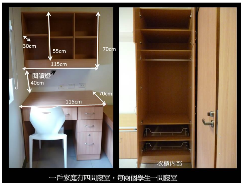
一戶家庭有四間寢室，每兩個學生一間寢室