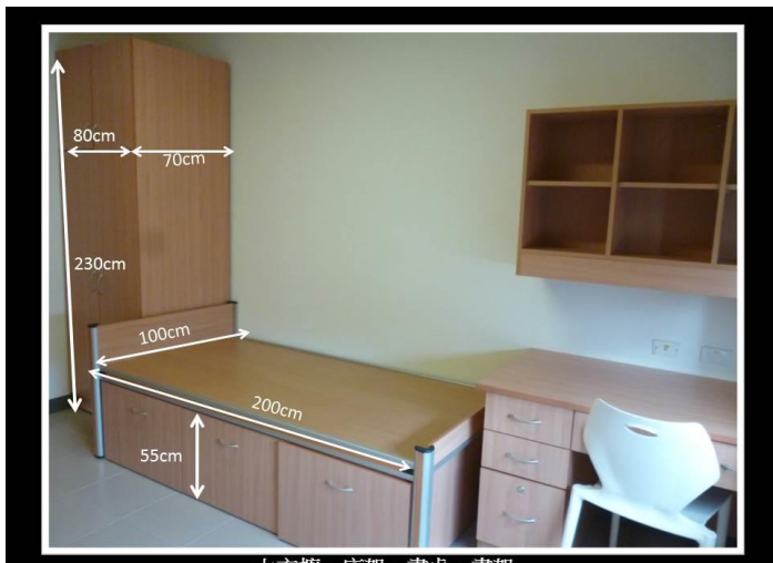
衣櫃、床架、書桌、書架